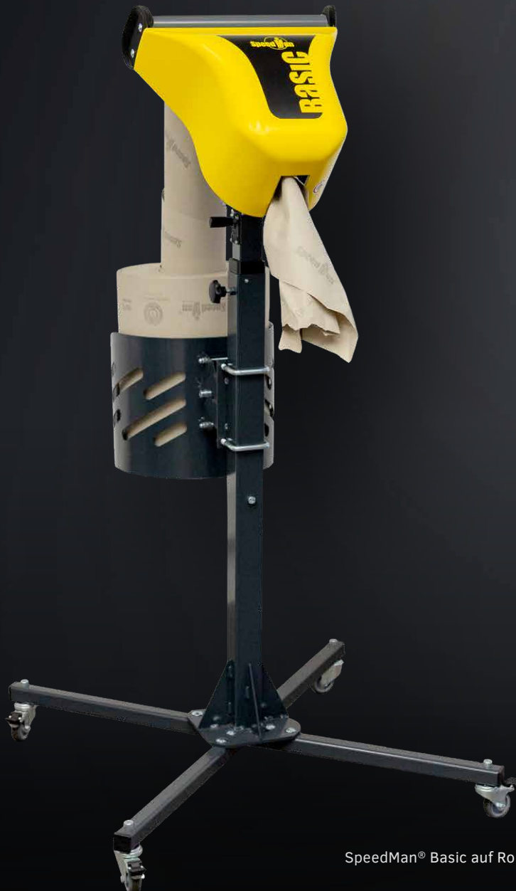
SpeedMan® Basic auf Rollgestell