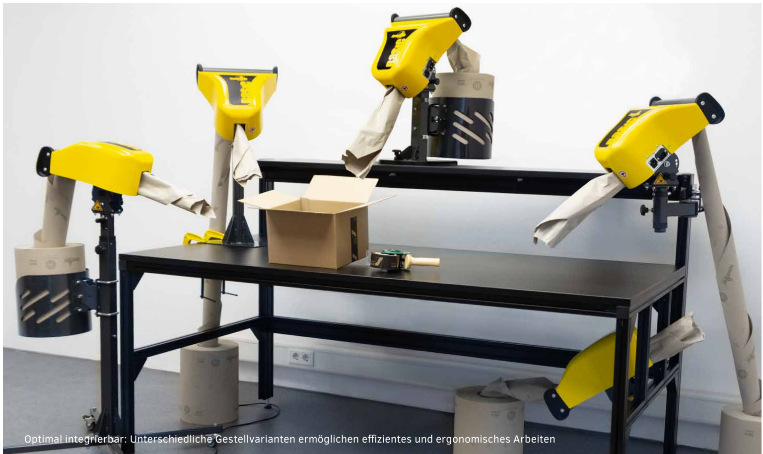
Optimal integrierbar: Unterschiedliche Gestellvarianten ermöglichen effizientes und ergonomisches Arbeiten