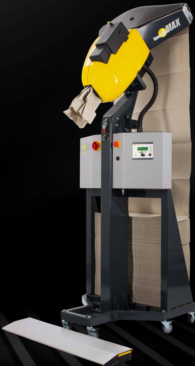
SpeedMan® MAX avec support pour pile de papier ComPackt®