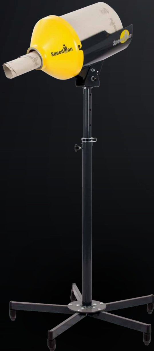
SpeedMan® Classic avec support à roulettes