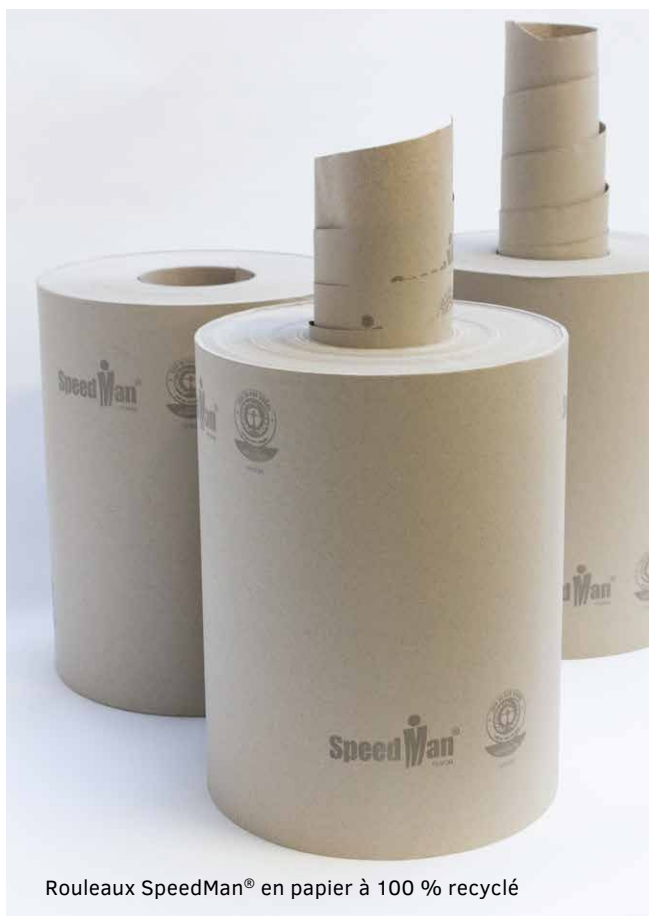
Rouleaux SpeedMan® en papier à 100 % recyclé