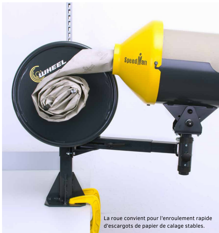
La roue convient pour l'enroulement rapide d'escargots de papier de calage stables.