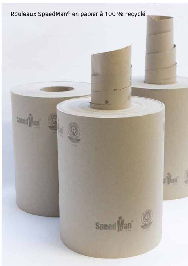
Rouleaux SpeedMan® en papier à 100 % recyclé