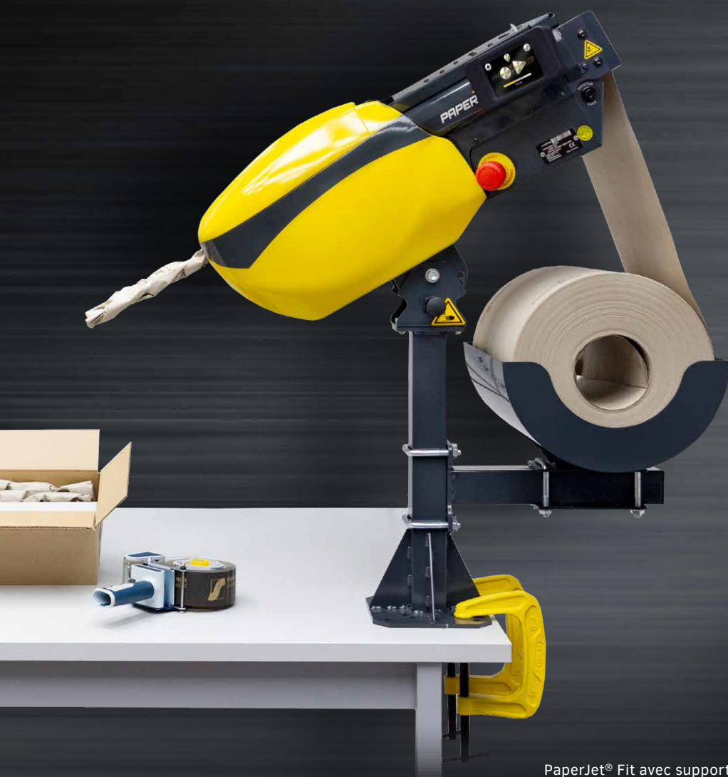
PaperJet® Fit avec support sur table