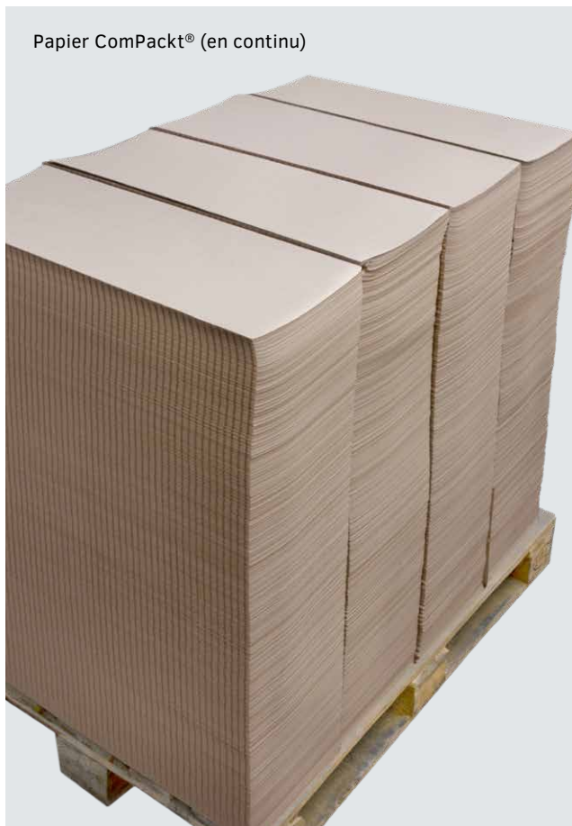
Papier ComPackt® (en continu)