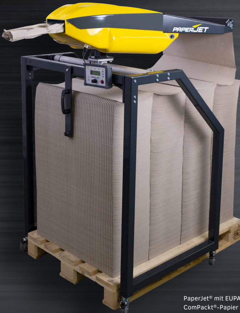
PaperJet® mit EUPAL-Gestell und ComPackt®-Papier (endlos)