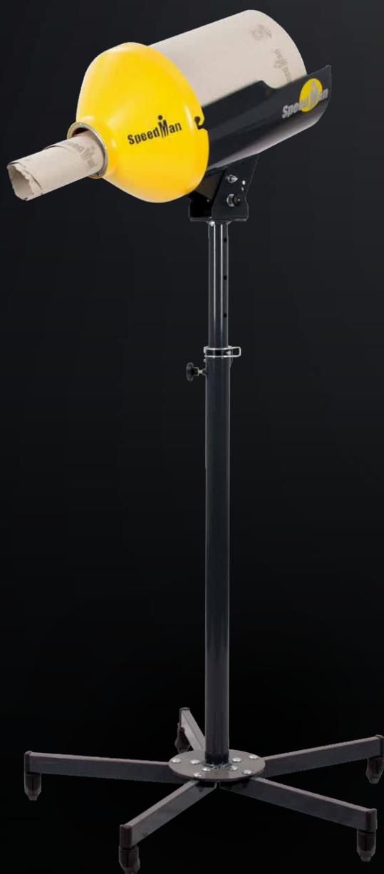
SpeedMan® Classic mit Rollgestell